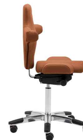
Abb. mit Sattel-Sitz [89], ohne Armlehnen, Stoffgruppe 1, CSE06 Cycle (rot), mit Alu-Fußkreuz [53]

1 Large Aluminium-Fußkreuz Höhere Sitzhöhe