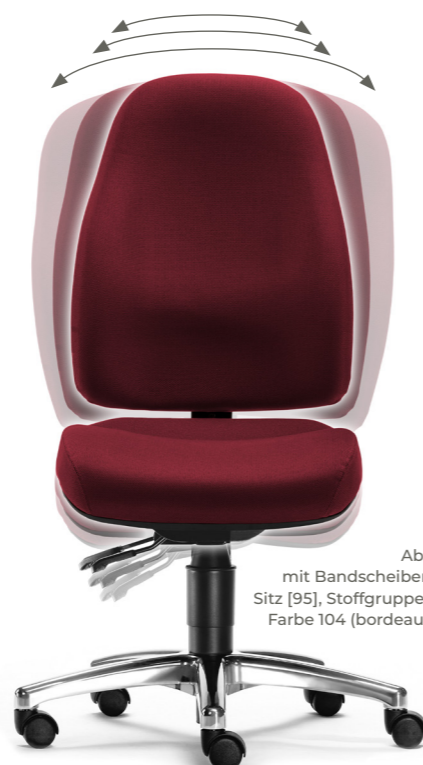
Abb. mit Bandscheiben-Sitz [95], Stoffgruppe 1, Farbe 104 (bordeaux)