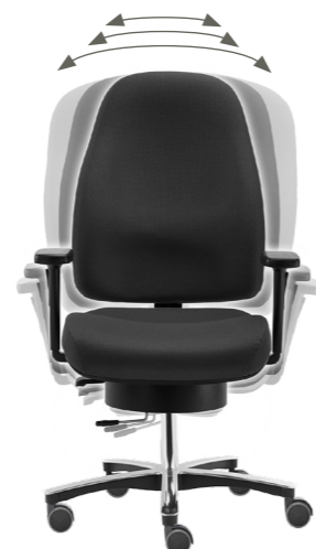
Abb. mit 3D-Pending-Mechanik, Stoffgruppe 1, Farbe 112 (dunkelgrau) mit XL Alu-FK [59-1]

Die Bandscheiben werden besser mit Nährstoffen versorgt. Mehr Blut wird durch die Adern gepumpt, das Herz schlägt schneller, Kreislauf und Lunge werden gestärkt.