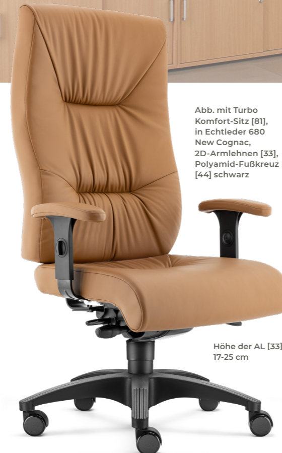
Abb. mit Turbo Komfort-Sitz [81], in Echtleder 680 New Cognac, 2D-Armlehnen [33], Polyamid-Fußkreuz [44] schwarz