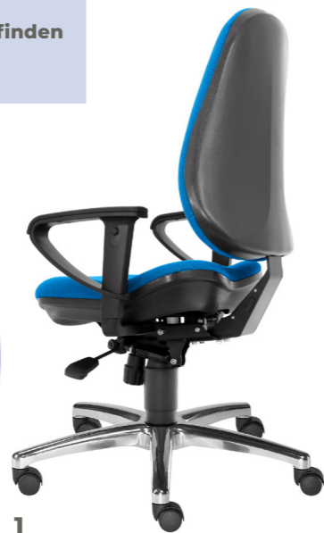
1 M Gestellfarbe schwarz, mit Alu-Fußkreuz [55]

Eine Übersicht der verfügbaren Stoffe finden Sie am Katalogende.