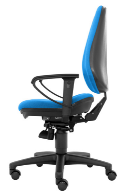
1 XL XLarge bis 150 kg