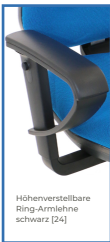
1 Höhenverstellbare Ring-Armlehne schwarz [24]

Sitzhöhe stufenlos einstellbar. Automatische Verstellung der Sitzneige für stetige Aufrichtungsimpulse. Sitz und Rückenlehne passen sich synchron Ihrem Bewegungsablauf an. Höhenverstellbare PROFI-Rückenlehne mit integrierter Lordosenstütze, mit vollflächiger Rückenschale.