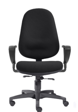
1 S Small bis 60 kg