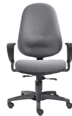
1 L Large bis 130 kg