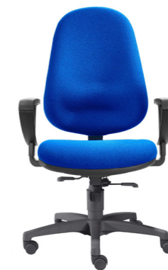
1 M Medium bis 100 kg