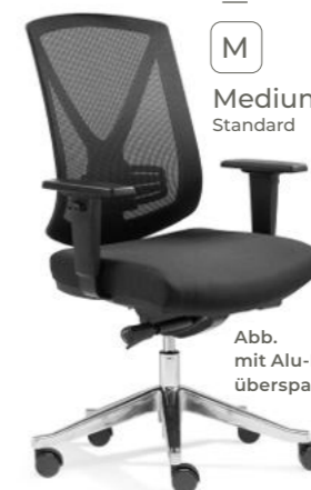
Abb. mit Alu-Fußkreuz überspannt [50]