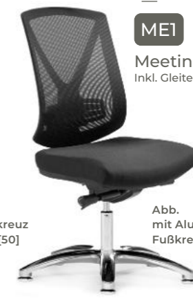
Abb. mit Aluminium-Fußkreuz [51]