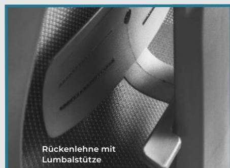
Rückenlehne mit Lumbalstütze

Sitzhöhe: 48-58 cm Sitzbreite: 51 cm Sitztiefe: 50 cm + 6 cm Lehnenhöhe: 57 cm Gesamthöhe: 105-115 cm Gesamttiefe: 70 cm Höhe der AL vom Sitzpolster: bei AL [31]: 19-27 cm bei AL [36]: 18-28 cm Gewicht: 19 kg Lieferzustand: Komplett montiert VE: 1 Stück Lieferzeit: 2-7 Tage