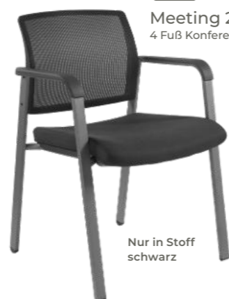
Nur in Stoff schwarz