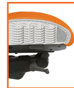
Abb. mit Bandscheiben-Sitz [95] im Querschnitt, Polyamid-Fußkreuz [44] mit Rollen für Hartböden [15]

Abb. mit Wellness-Sitz [85], Stoffgruppe 1, Farbe 110 rot, mit Alu-Fußkreuz [51]