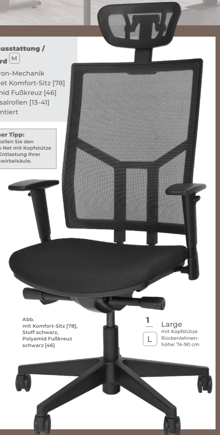
Abb. mit Komfort-Sitz [78], Stoff schwarz, Polyamid Fußkreuz schwarz [46]

Unser Tipp: Bestellen Sie den Ergo Net mit Kopfstütze zur Entlastung Ihrer Halswirbelsäule.